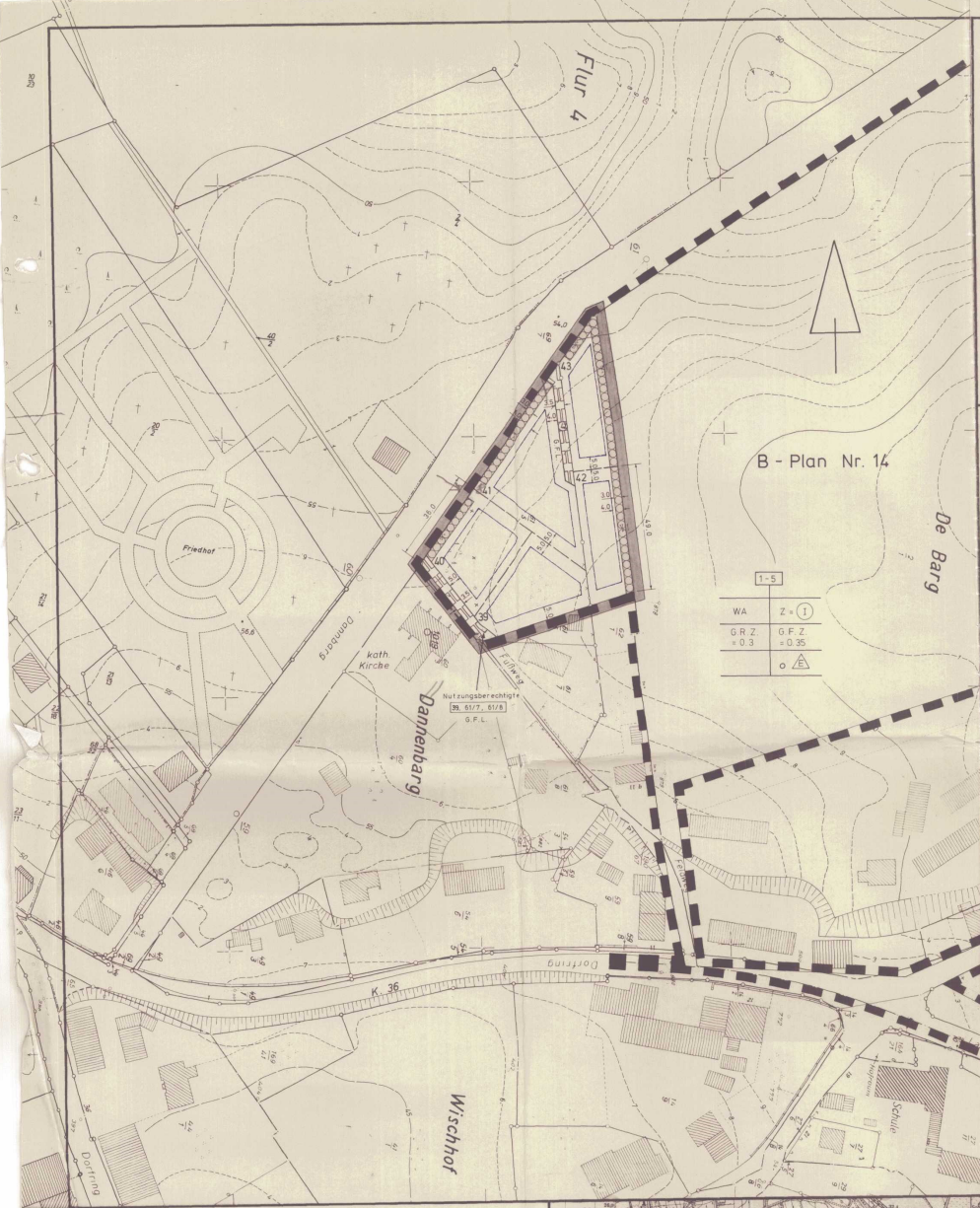
B - Plan Nr. 14